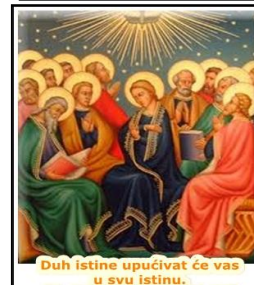
Duh istine upućivat će vas u svu istinu.

Još vam mnogo imam kazati, ali sada ne možete nositi. No kada dođe on - Duh Istine -upućivat će vas u svu istinu; jer neće govoriti sam od sebe, nego će govoriti što čuje i navješćivat će vam ono što dolazi. On će mene proslavljati jer će od mojega uzimati i navješćivati vama. Sve što ima Otac, moje je. Zbog toga vam rekoh: od mojega uzima i - navješćivat će vama.