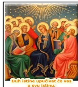
Duh Istine upućivat će vas u svu istinu.

Još vam mnogo imam kazati, ali sada ne možete nositi. No kada dođe on - Duh Istine -upućivat će vas u svu istinu; jer neće govoriti sam od sebe, nego će govoriti što čuje i navješćivat će vam ono što dolazi. On će mene proslavljati jer će od mojega uzimati i navješćivati vama. Sve što ima Otac, moje je. Zbog toga vam rekoh: od mojega uzima i - navješćivat će vama.