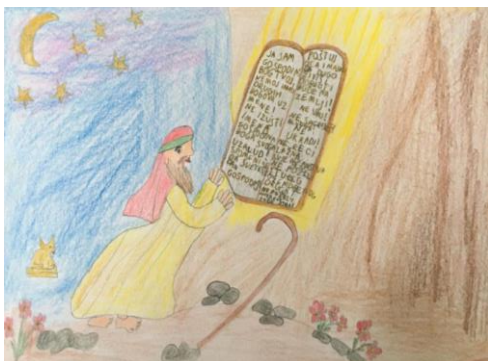
Mojsije prima Deset zapovijedi Tomislav Tomljenović 3.c