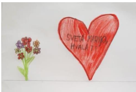
Svibanj je Marijin mjesec Rita Orešković 1.c